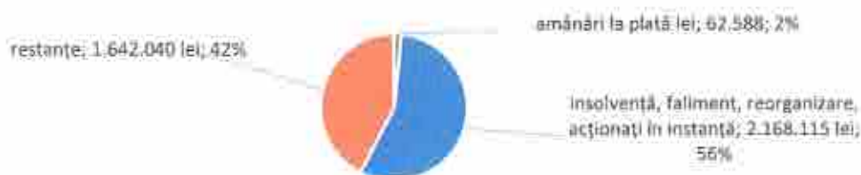
Creanțe restante la data de 31.12.2025

Evoluția într-o perioadă de 5 ani a creanțelor restante este următoarea: